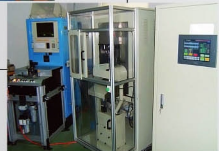
Impeller Vertical Dynamic Balance & AT Removing-material Machine