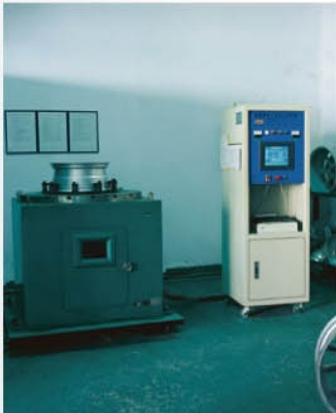
Bending Endurance Test