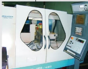
"HARDINGE" Turbine Machining High-precision NC Grinder