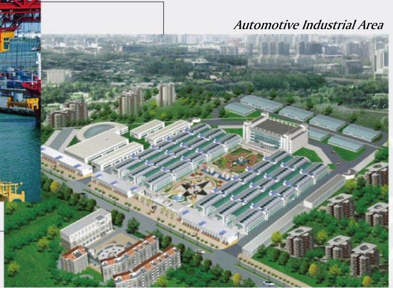
Automotive Industrial Area