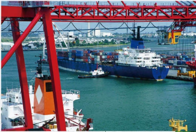
BeiLun Seaport, Ningbo