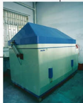
Salt Spray Test