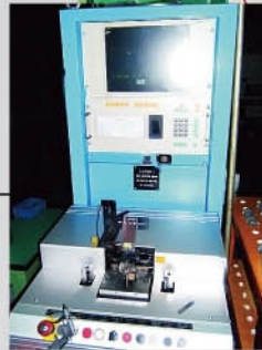
Turbine Vertical Dynamic Balance