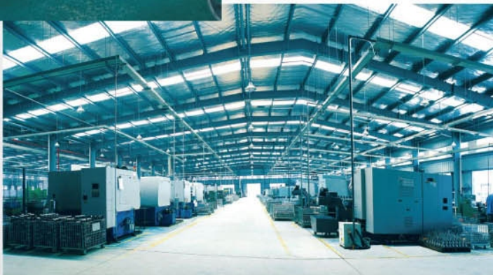
Our branch factory's production line