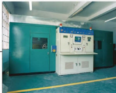
Radial Load Endurance Test